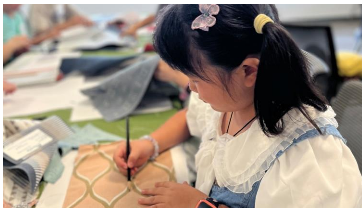
GRA儿童夏令营（中国苏州）

这种基于合作和信任的伙伴关系模式，我们正在其他格伦雷文社区复制推广。早期教育是每个社区都非常关注的问题，各地的团队正在建立关系，帮助当地的孩子们获得高质量的教育。