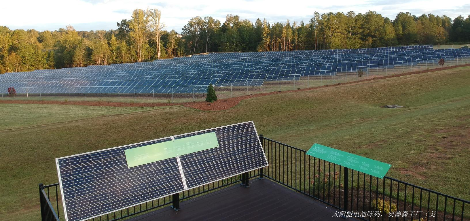
太阳能电池阵列，安德森工厂（美）