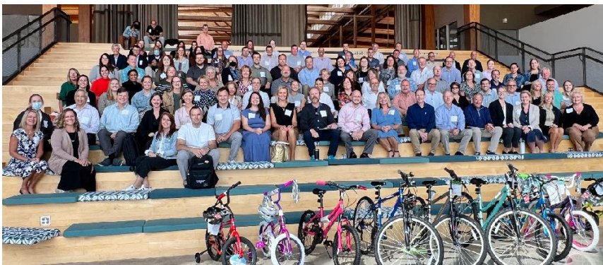
材料解决方案集团年会自行车制造团队（美国北卡罗来纳州）

在格伦雷文，影响力合作关系正在不断发展，变得比以往任何时候都更加深入和坚固。然而，从小时工到月薪员工，他们对投资社区未来的深切承诺并未改变。