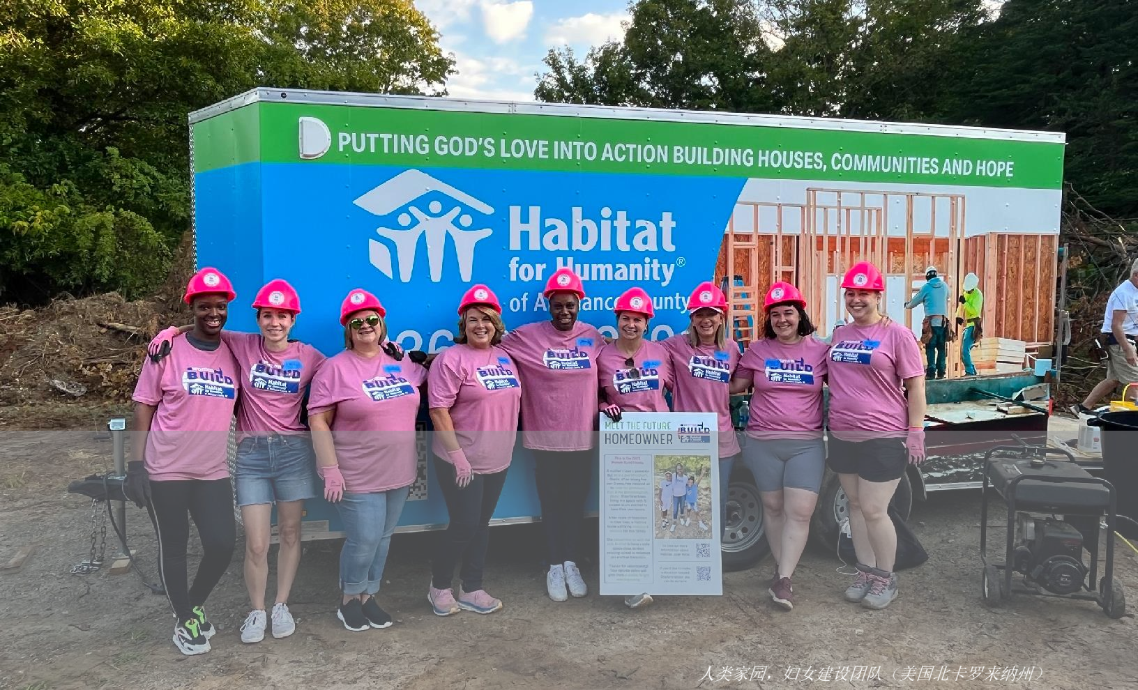
人类家园，妇女建设团队（美国北卡罗来纳州）